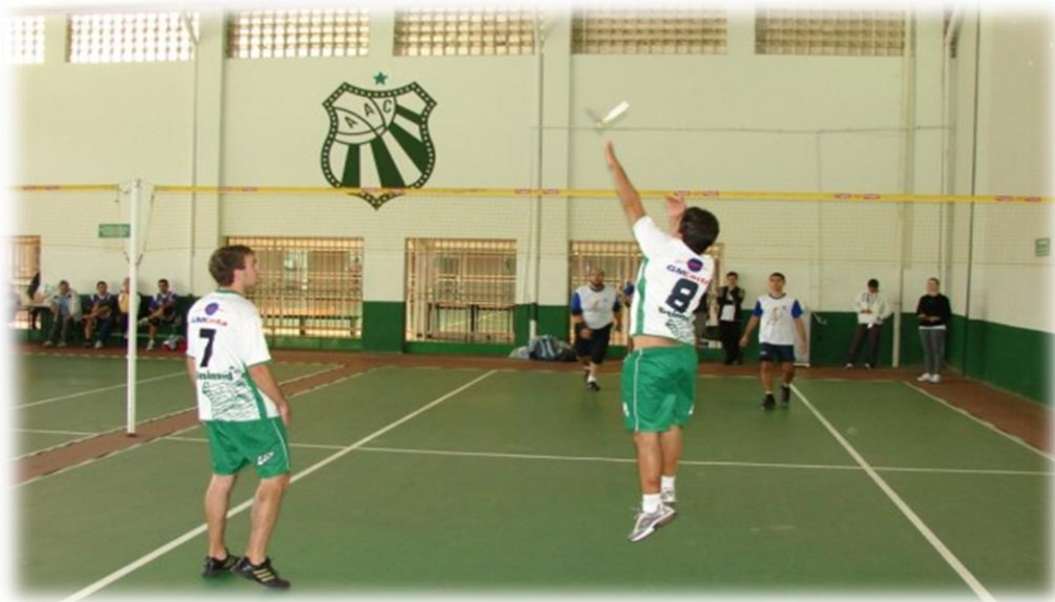
Atleta realizando uma cortada (ataque)