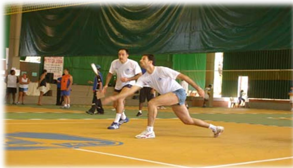
Atleta realizando um toque por baixo

No toque por baixo, o movimento do atleta se assemelha ao ato de pegar algo no chão, inclinando o corpo para frente e mantendo os joelhos levemente flexionados para melhor equilíbrio e controle. Já no toque por cima, o movimento é executado com os braços acima da linha dos ombros, similar a uma cortada no voleibol, e pode ser realizado com ou sem salto. Este movimento requer uma boa coordenação e força no braço para que a peteca atravesse a rede com precisão.