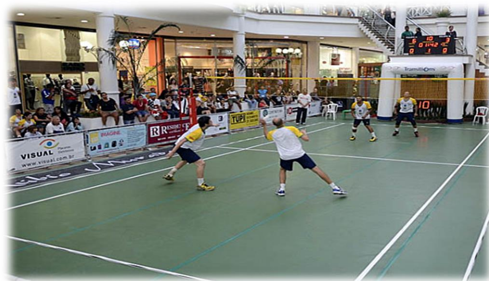
Atletas realizando deslocamentos