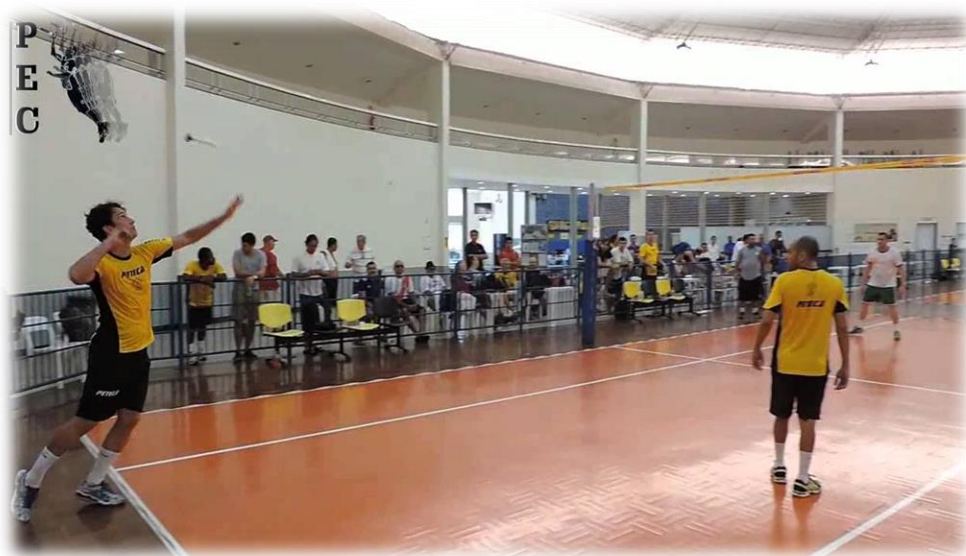
Atleta realizando um saque por cima