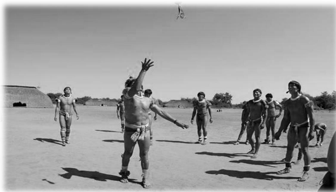
Indígenas jogando peteca

O objeto que hoje conhecemos como peteca tem sido utilizado por diversos povos na América do Sul e Central. Relatos históricos e evidências materiais indicam que a prática da peteca já era disseminada antes da chegada dos colonizadores portugueses ao Brasil, em 1500. O jogo ou brincadeira de peteca variava conforme as culturas específicas, adotando diferentes formas de uso.