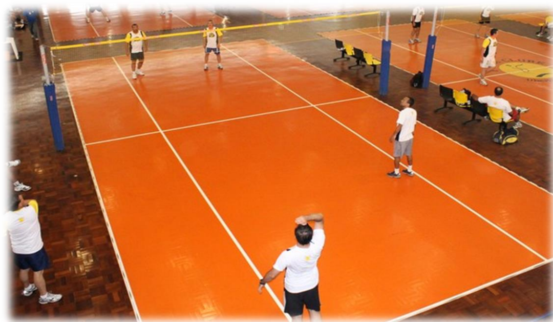
Representação de uma partida de peteca

✓ Atualmente, a peteca é jogada tanto de maneira recreativa quanto competitiva, com campeonatos estaduais e nacionais. As regras básicas do jogo incluem a divisão do campo por uma rede, semelhante à do voleibol, e a contagem de pontos que se assemelha ao badminton. Cada partida é disputada por duas equipes, que podem ser formadas por um ou dois jogadores de cada lado.