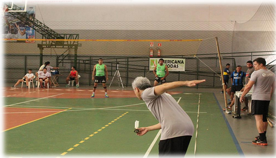
Atleta executando o saque por baixo