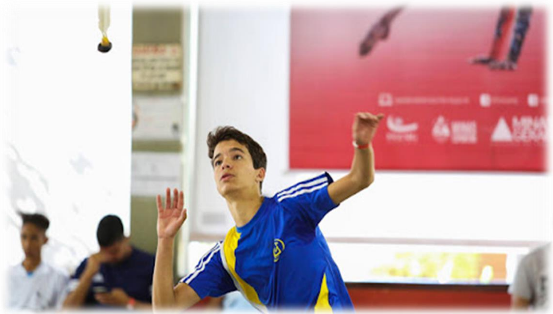
Atleta golpeando a peteca