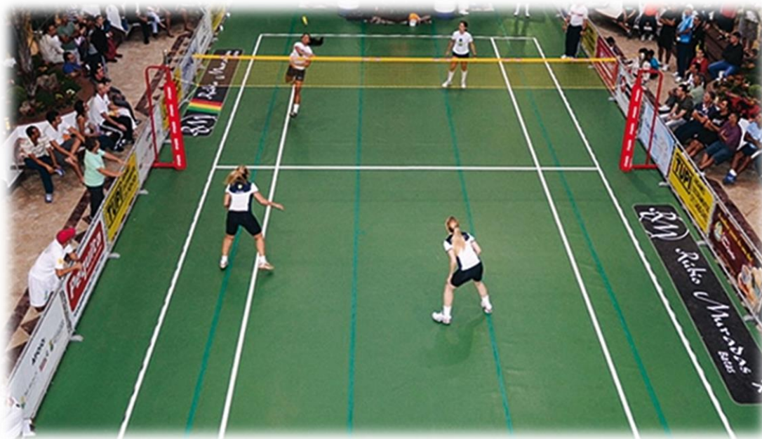
Jogo feminino de peteca