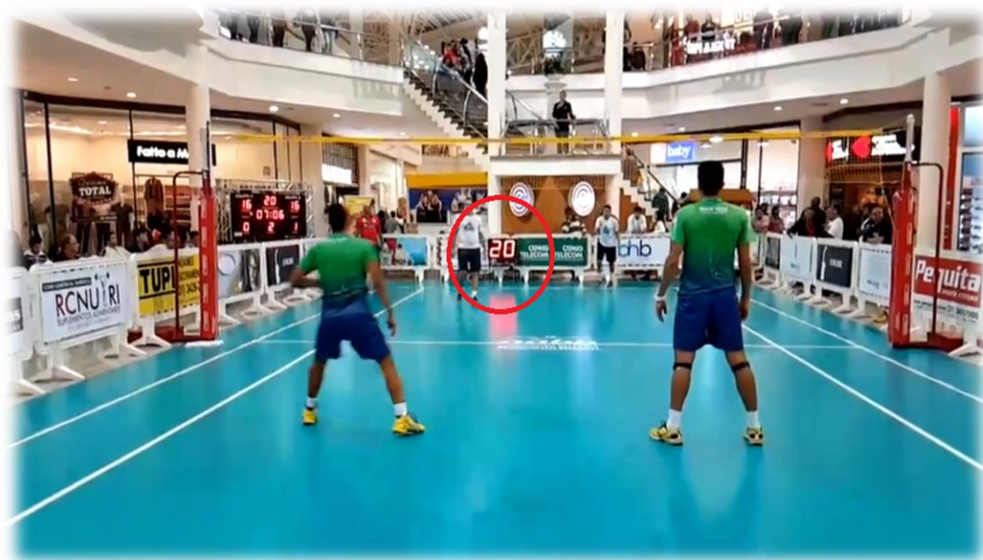
Cronômetro da tomada de saque

✓ Na peteca, a equipe que saca tem um tempo oficial de VINTE SEGUNDOS para conquistar o ponto em disputa. Se a equipe que sacou não conseguir concretizar o ponto dentro desse tempo, o ponto será concedido à equipe adversária .