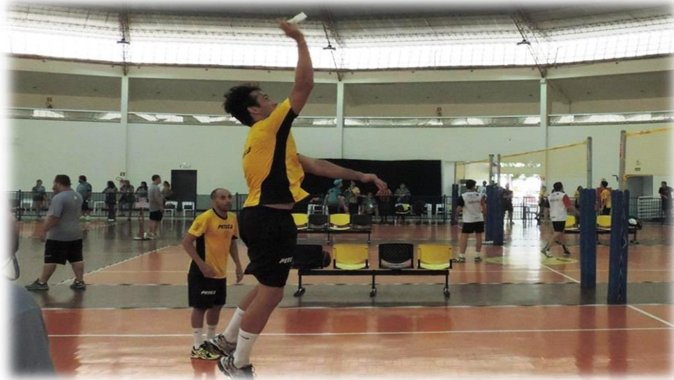
Atleta realizando um toque por cima