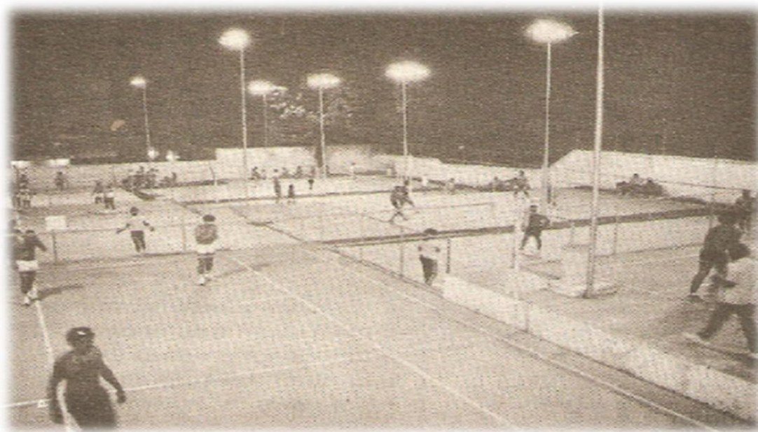
Jogos de peteca sendo realizados em Belo Horizonte em 1984